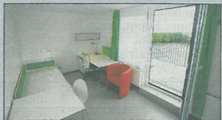
Auf der Schmelz im 15. Bezirk herrscht ein gutes Preis-Leistungs-Verhältnis

● Sun Quarter In Favoriten hat sich ein neues Projekt auf die kurz- bis mittelfristigen Wohnbedürfnisse von Singles konzentriert. Der Preis für die 20 jeweils 33 Quadratmeter großen Apartments liegt bei 638 Euro monatlich. Vally-Weigl-Gasse 5, 1100 Wien, Tel. 01/546 25-44, www.kallco.at