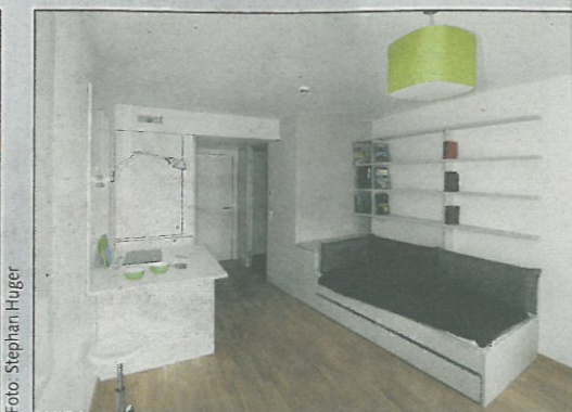
Exklusiv: die Campus Lodge in Leopoldstadt