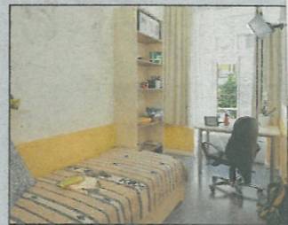
Generalsaniert: das „neue“ Home4Students in Döbling

● Milestone Rund 150 Meter von der neuen WU entfernt will das Projekt einen neuen Meilenstein des studentischen Wohnens für Wien setzen. Den Bewohnern stehen zahlreiche Gemeinschaftsflächen wie ein 1.000 Quadratmeter großer Garten, Learning Rooms und ein Fitnessraum zur Verfügung. Die